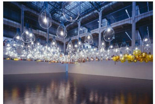
Tobias REHBERGER 《anderer》 2002 Installation view: Geläut - bis ichs hör... , Museum für Neue Kunst, ZKM, Karlsruhe 2002 © tobias rehberger, 2002

また現代美術は体験型の作品も多く、ぜひ身近な方々と遊園地にあそびに行くような気楽さでお越しいただきたいと存じます。今年の夏はぜひアート体験をみなさまと共有したいと願っています!