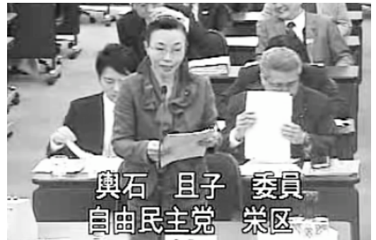
2013年2月の予算委員会で局別質問 (横浜市HP録画面より)

http://www.yokohama-city.stream.jfit.co.jp/giin_result.php?GIINID=72842