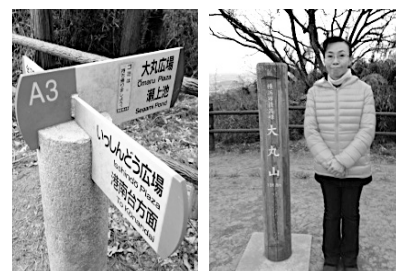
視察したのはまだ風が冷たい頃でした 横浜市の最高峰大丸山(156.8m)にて