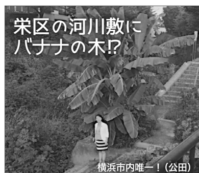
栄区の河川敷にバナナの木!?